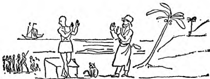
Юный Вашингтон говорит Инке, что надобно округлить все шероховатости.

Ну вот, обривши антиподов, он и говорит Инке, что, дискать, еще надобно округлить все шероховатости. Только Инка, знаете, никак на это не согласился.