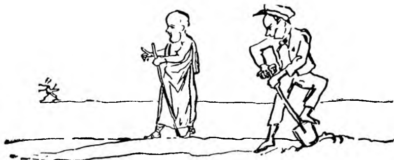
Философ проходит мимо. Вдали уходит г. Златогор.

После того проходит мимо философ. Вот видите, дождался же философ! проходит мимо философ.