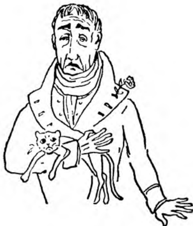
Юный президент Вашингтон.

Ну что вы думаете, ведь Вашингтон не всегда же был президентом! Он, я вам скажу, был прежде вот то есть так просто мальчиком; не то чтобы иным чем, а вот так просто-таки мальчиком в лавочке. Вот, знаете, он и начал собирать: сперва булавки. Вот как увидит на полу булавку, вот он, знаете, так и лезет прямо на булавку; потом ниточки, а там, знаете, вот, например, ореховую скорлупу или там прочее что, знаете, например, ногти и т. д.