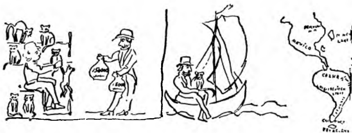
Вашингтон покупает кошку. Вашингтон едет в Америку.

Ну вот, знаете, он эдаким образом все собирал, собирал и наконец собрал сколько вы думаете? Он собрал, я вам скажу, 300 000 000 миллионов. Ну что ему делать с этими 300 000 000 миллионами? Вот он, знаете, и купил себе — кошку! Купил себе кошку и поехал в Америку.