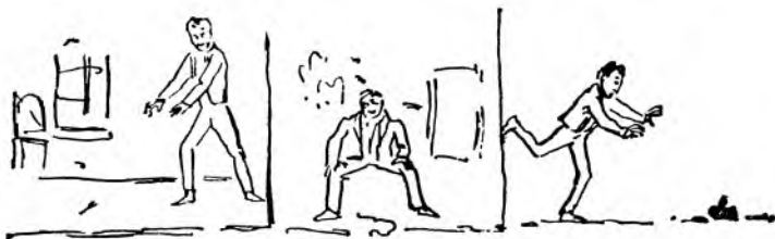
Вашингтон собирает разные вещи.

Ну вот, знаете, он эдаким образом все собирал, собирал и наконец собрал сколько вы думаете? Он собрал, я вам скажу, 300 000 000 миллионов. Ну что ему делать с этими 300 000 000 миллионами? Вот он, знаете, и купил себе — кошку! Купил себе кошку и поехал в Америку.