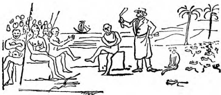
Юный Вашингтон бреет антиподов.

пренесносно. Обрей нас, великий юный Вашингтон!» А надобно вам сказать, что лавочка, в которой юный Вашингтон воспитывался, была лавочка одного цирюльника. Юный Вашингтон там в продолжение четырех лет брил у мужиков колены, а у прохожих шляпы за самую сходную цену. Вот он, знаете, и вынимает из кармана бритву, намазывает сперва Инке голову и выбривает ему глещь наподобие как у капуцинов. Потом, знаете, он принимается и за прочих своих антиподов и всех очень чисто обривает, так, знаете, кому голову, кому бороду, так что все, знаете, очень довольны.